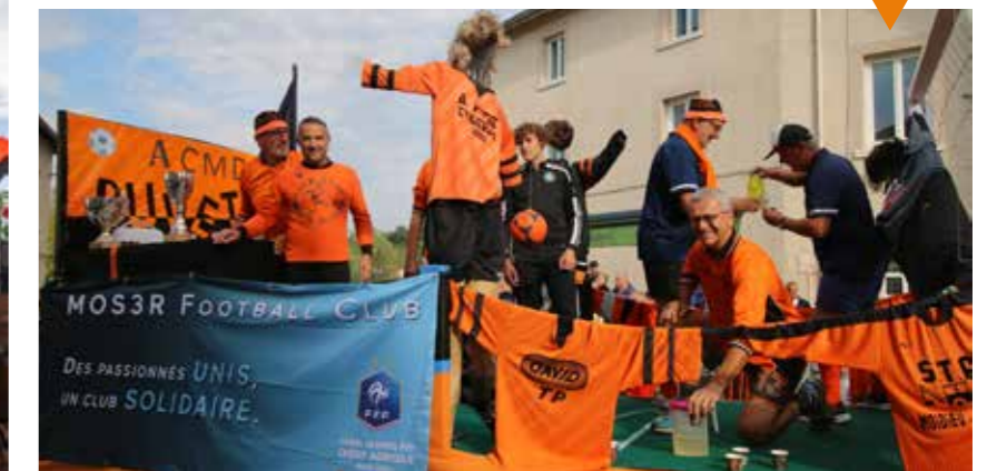
La folie douce : le char de loin le plus bruyant et le plus redouté. Aspergeant tantôt le public, tantôt les façades des maisons et commerces, il a crépi le village couleur "bonne humeur". Juste du bonheur en barre.