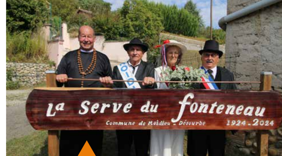
La serve du fonteneau : un lieu renommé sur notre village à l'occasion de la fête des 100 ans. Ici les mariés, le prêtre et le maire, à l'issue du faux mariage !