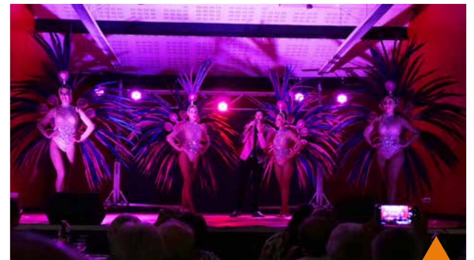
Soirée repas et cabaret à prix plafonné dans une salle des fêtes bondée !

village, on entendait déjà depuis un quart d'heure une musique provenant des chars et notamment du loufoque char de "la folie douce" de 1924. A son bord, une horde de zozos déchaînés brandissant fumigènes, bouteilles, projetant de la paille et sautant frénétiquement au son des platines embarquées à l'arrière du char.