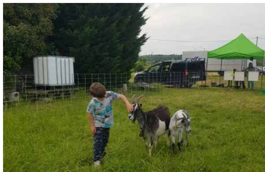
Ce jour là, la ferme accueillait la manifestation « Le Printemps des fermes ». Une opération qui devrait être reconduite sur ce site.