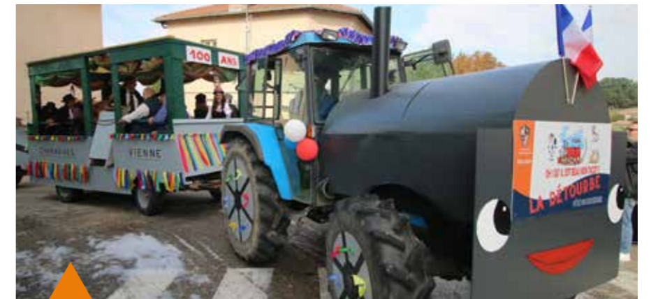
Superbe reproduction du Tacot ! Tracteur agricole caréné, en forme de locomotive, tractant un wagon de voyageurs, conduit par le mécanicien.

Même si maintenant ce rattachement est une chose pleinement acquise et acceptée, nous les anciens restons Détourbois dans nos cœurs.