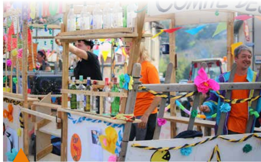
Le Comité des Fêtes : Un char esprit "guinguette survoltée". Une buvette géante à ciel ouvert, peuplée de serveuses hautes en couleur qui haranguaient la foule en jetant des cotillons.

La Chasse : Ensemble composé d'une équipe de chasseurs, accompagnée d'un magnifique chien de race "Gascon saintongeois" qui participait activement au spectacle de rue en donnant la voix à chaque coup de corne de chasse !