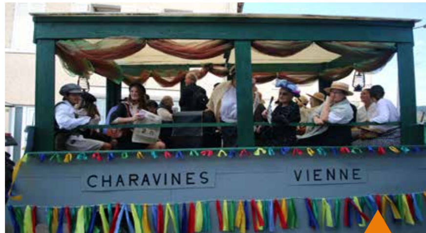
Le Tacot de la Détourbe : un énorme double char tirant un wagon de voyageurs d'un ancien temps puis une charrette de démonstration des métiers (charron, puisatier, etc.).