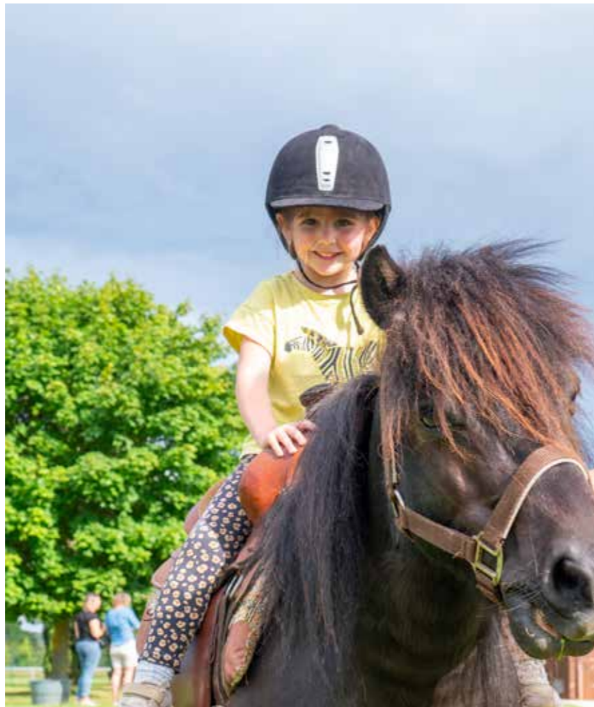
Trinity, au top de sa forme, lord de la balade en poney !

Nous vous y attendons nombreux ! Et si le temps d'une manifestation, l'envie vous prend de nous rejoindre, n'hésitez pas !