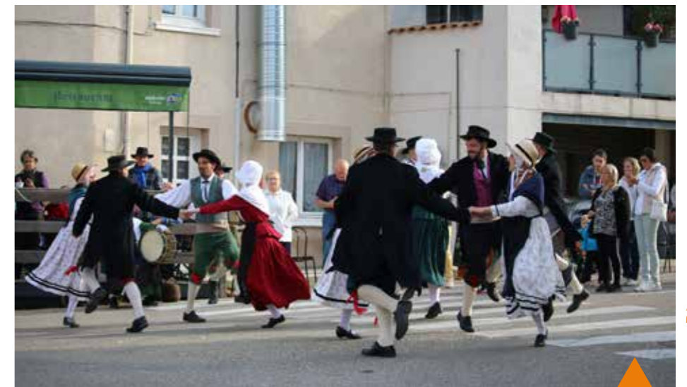
L'association "Cru de Paille" a contribué à animer cette journée, du centre-village jusqu'au site de Narboirie.