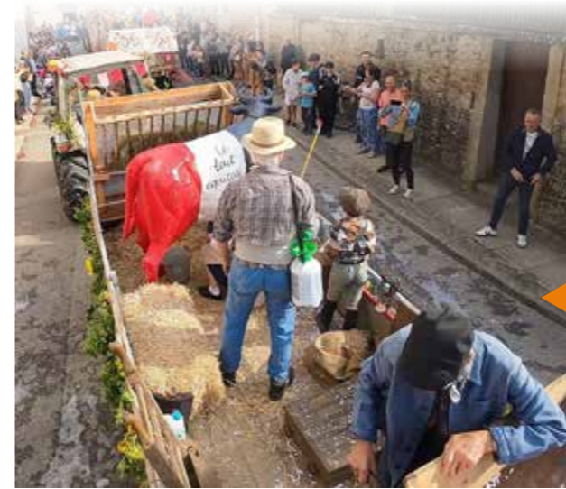
L'agriculture de la Détourbe : Une vache bleu blanc rouge promeut le lait équitable ! Un char à l'ancienne avec ses bottes de pailles, ses agriculteurs. Il y a même une mangeoire pour l'alimentation des bovins !