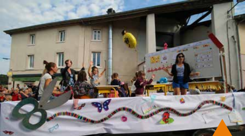
Les écoles : Le Sou des écoles et La classe de la Détourbe sur un double char ! Pour deux fois plus de plaisir ! Une classe d'antan avec ses bureaux anciens, son poêle à bois, son tableau, ses ardoises, le globe terrestre... animée par une institutrice et des élèves en tenue d'époque. Sur le deuxième char tracté : une classe moderne au décor actuel.