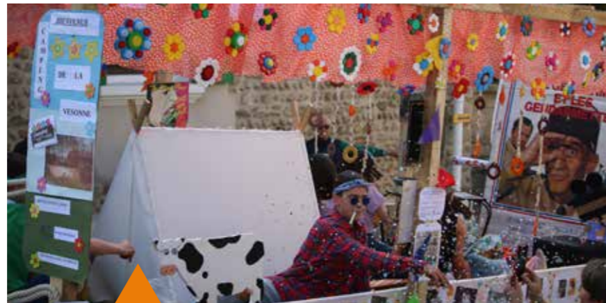
Le Nouvel Hair : Une prouesse de décoration avec des enfants en tenues des années 60. Des photos de classes et des disques vinyls de cette époque embellissent un char peuplé de hippies.